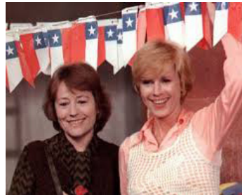
1975 IL PLEUT SUR SANTIAGO de Helvio Soto avec Mimsy Farmer