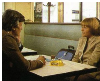
1981 UNE ROBE NOIRE POUR UN TUEUR de José Giovanni avec Jacques Perrin