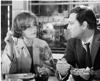
1965 TROIS CHAMBRES À MANHATTAN de Marcel Carné avec Maurice Ronet