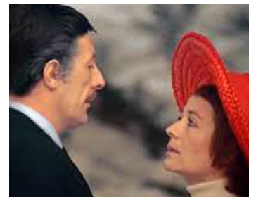
1972 LES FEUX DE LA CHANDELEUR de Serge Korber avec Jean Rochefort