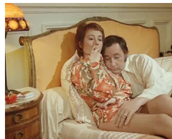
1971 LA MANDARINE d'Édouard Molinaro avec Philippe Noiret, Madeleine Renaud