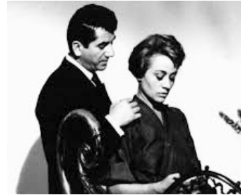
1960 LA PROIE POUR L'OMBRE d'Alexandre Astruc avec Daniel Gélin