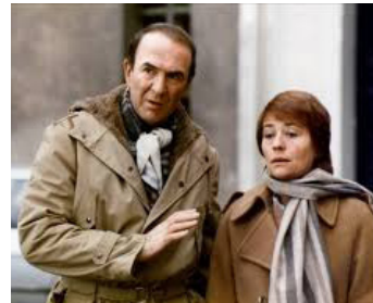
1978 CAUSE TOUJOURS... TU M'INTÉRESSES d'Édouard Molinaro avec Jean-Pierre Marielle