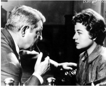
1958 MAIGRET TEND UN PIÈGE de Jean Delannoy avec Jean Gabin