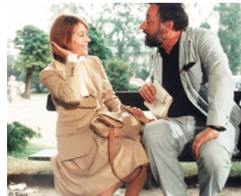
1977 TENDRE POULET de Philippe de Broca avec Philippe Noiret