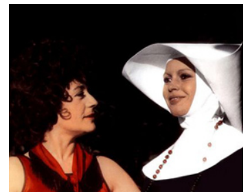
1970 LES NOVICES de Guy Casaril avec Brigitte Bardot