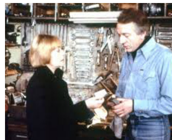
1981 LA VIE CONTINUE de Moshé Mizrahi avec Jean-Pierre Cassel