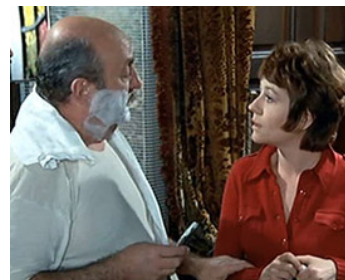
1969 ELLE BOIT PAS, ELLE FUME PAS, ELLE DRAGUE PAS MAIS ELLE CAUSE de M. Audiard avec B. Blier