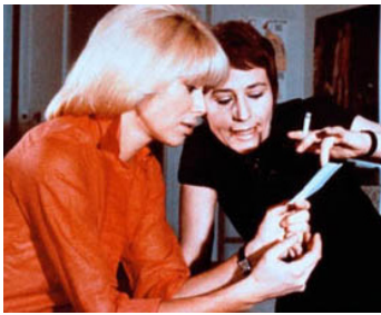
1972 IL N'Y A PAS DE FUMÉE SANS FEU d'André Cayatte avec Mireille Darc