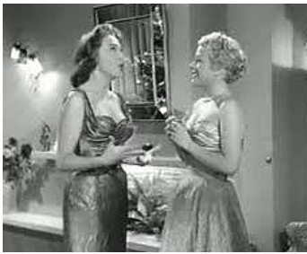
1955 TREIZE À TABLE d'André Hunebelle avec Micheline Presle