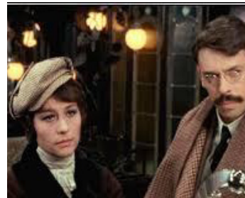
1968 LA BANDE À BONNOT de Philippe Fourastié avec Jacques Brel