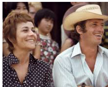
1969 UN HOMME QUI ME PLAÎT de Claude Lelouch avec Jean-Paul Belmondo