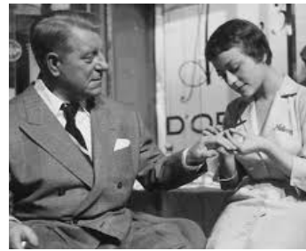
1957 LE ROUGE EST MIS de Gilles Grangier avec Jean Gabin