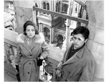
1960 ROCCO ET SES FRÈRES (Rocco e i fratelli) de Luchino Visconti avec Alain Delon