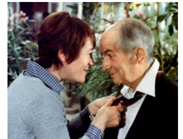
1978 LA ZIZANIE de Claude Zidi avec Louis De Funès