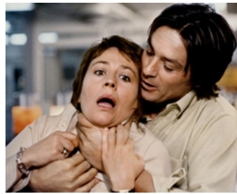
1972 TRAITEMENT DE CHOC d'Alain Jessua avec Alain Delon