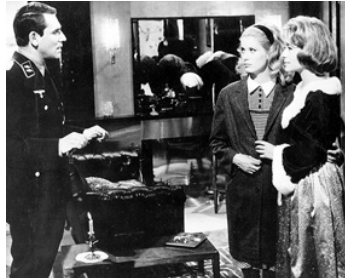
1962 LE VICE ET LA VERTU de Roger Vadim avec Robert Hossein, Catherine Deneuve