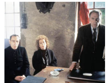
1985 PARTIR, REVENIR de Claude Lelouch avec Jean Bouise, Jean-Louis Trintignant