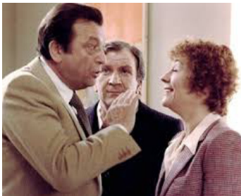
1978 VAS-Y MAMAN de Nicole de Buron avec Claude Piéplu, Pierre Mondy