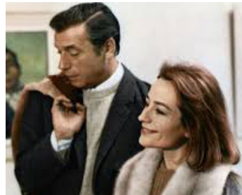
1967 VIVRE POUR VIVRE de Claude Lelouch avec Yves Montand