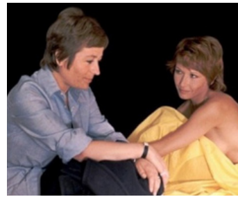
1972 JULIETTE ET JULIETTE de Remo Forlani avec Marlène Jobert