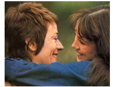
1974 LA GIFLE de Claude Pinoteau avec Isabelle Adjani