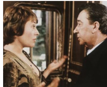
1975 LE GITAN de José Giovanni avec Paul Meurisse