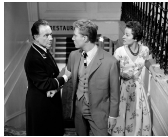
1956 L'HOMME AUX CLÉS D'OR de Léo Joannon avec Pierre Fresnay, Gil Vidal