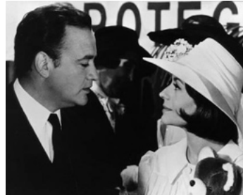
1964 LA BONNE SOUPE de Robert Thomas avec Raymond Pellegrin