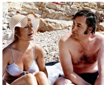
1971 LA VIEILLE FILLE de Jean-Pierre Blanc avec Philippe Noiret