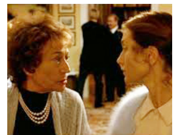
2001 LA PIANISTE de Michael Haneke avec Isabelle Huppert