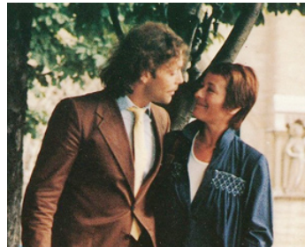
1978 LA CLÉ SUR LA PORTE d'Yves Boisset avec Patrick Dewaere