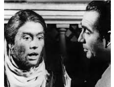
1964 LE MARI DE LA FEMME À BARBE de Marco Ferreri avec Ugo Tognazzi