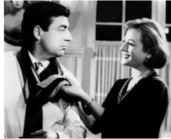
1958 LA CORDE RAIDE de Jean-Charles Dudrumet avec François Périer